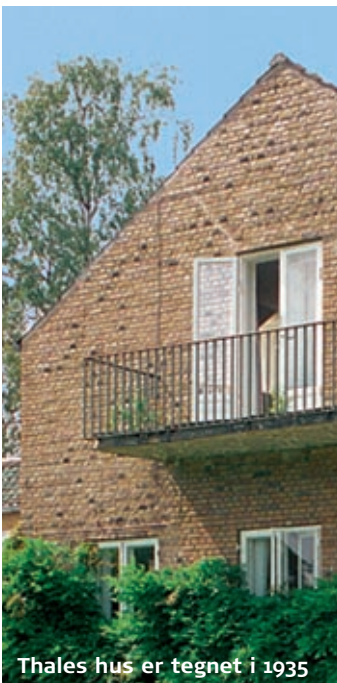
Thales hus er tegnet i 1935