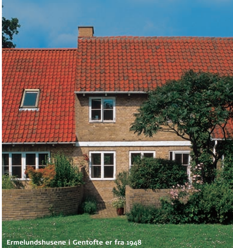
Ermelundshusene i Gentofte er fra 1948