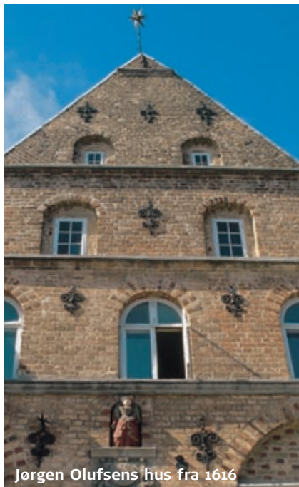
Jørgen Olufsens hus fra 1616